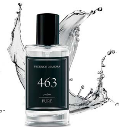
PARFEMI Količina: 50ml