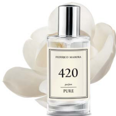
PARFEMI Količina: 50ml